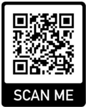
Apple iOS App